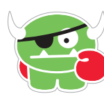
TARTAR THE TERRIBLE