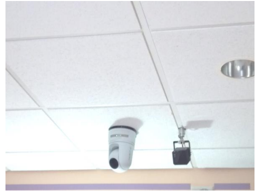
cámara y altavoz en el techo