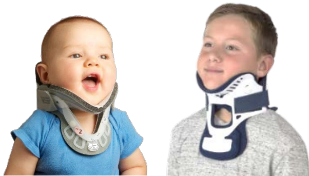
Collarín cervical pediátrico Aspen Collarín cervical pediátrico Miami J