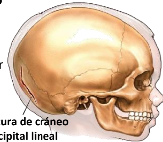
Fractura de cráneo occipital lineal derecha

El equipo médico puede ordenar una radiografía o una tomografía computarizada. Ambas pueden evaluar una fractura. A veces se necesita una exploración adicional para identificar lesiones detrás de la fractura.